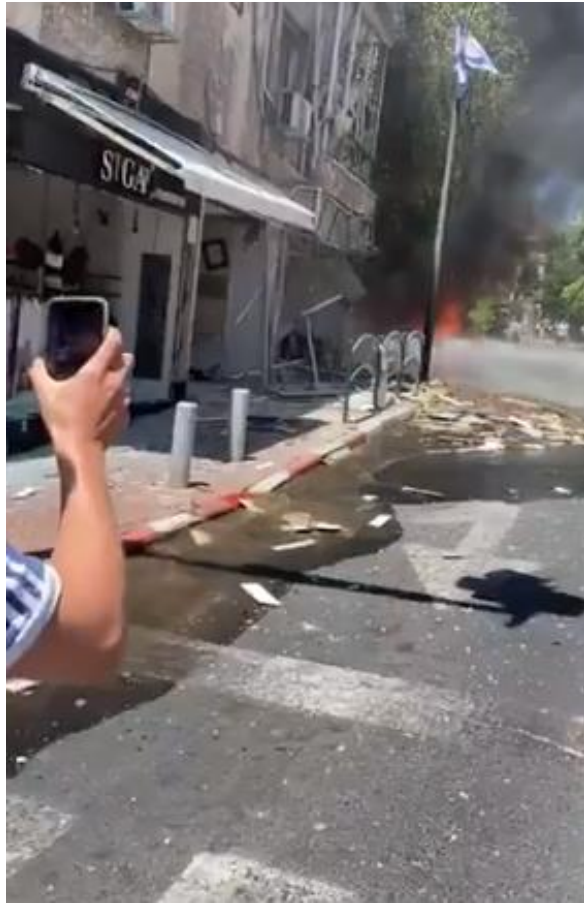
EDIFICIO BOMBARDEADO EN GAZA