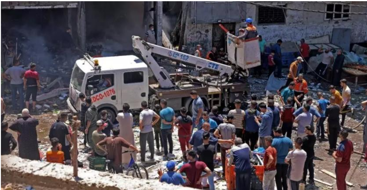
BOMBEROS PALESTINOS TRABAJAN EN EL SITIO DONDE IMPACTÓ UN ATAQUE ISRAELÍ, EN LA CIUDAD DE RAFAH, EN EL SUR DE LA FRANJA DE GAZA