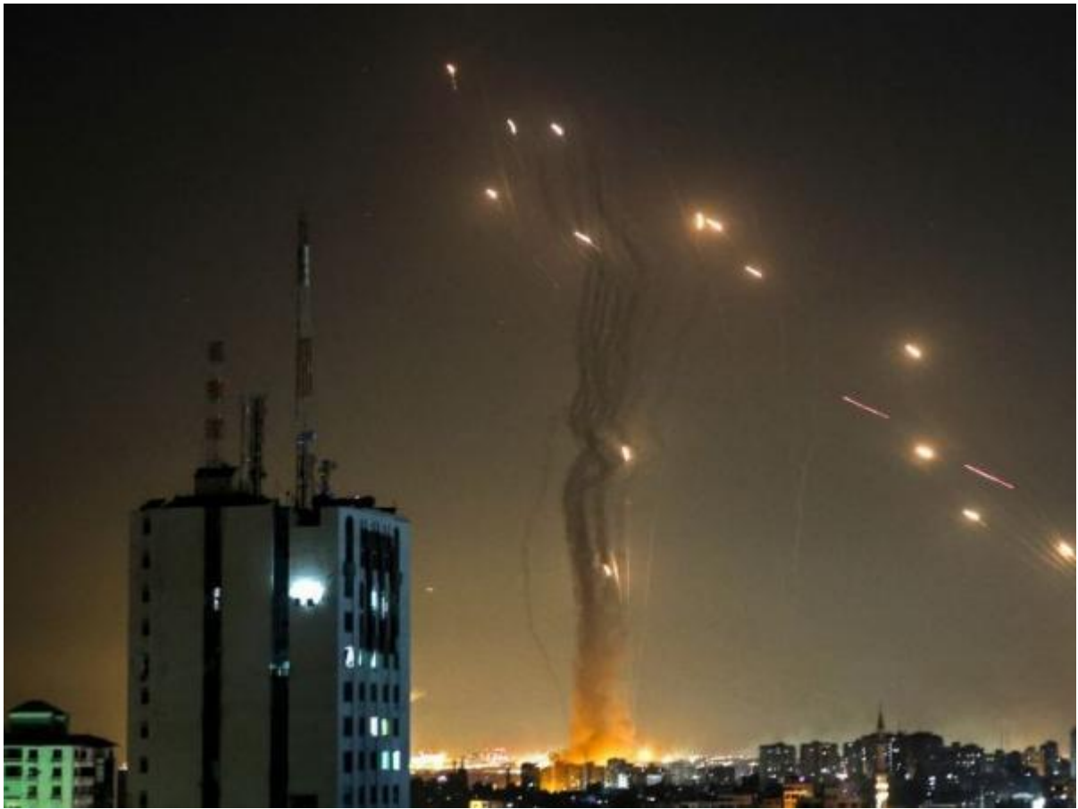
MISILES INTERCEPTADOS POR EL DOMO DE HIERRO ISRAELÍ