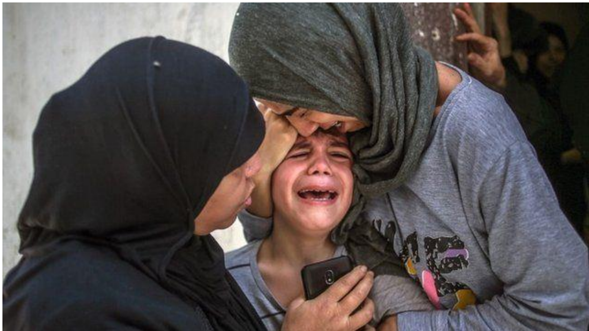
FAMILIARES DE UN ADOLESCENTE DE 15 AÑOS FALLECIDO POR LOS ATAQUES DE ISRAEL EN GAZA LLORAN SU MUERTE