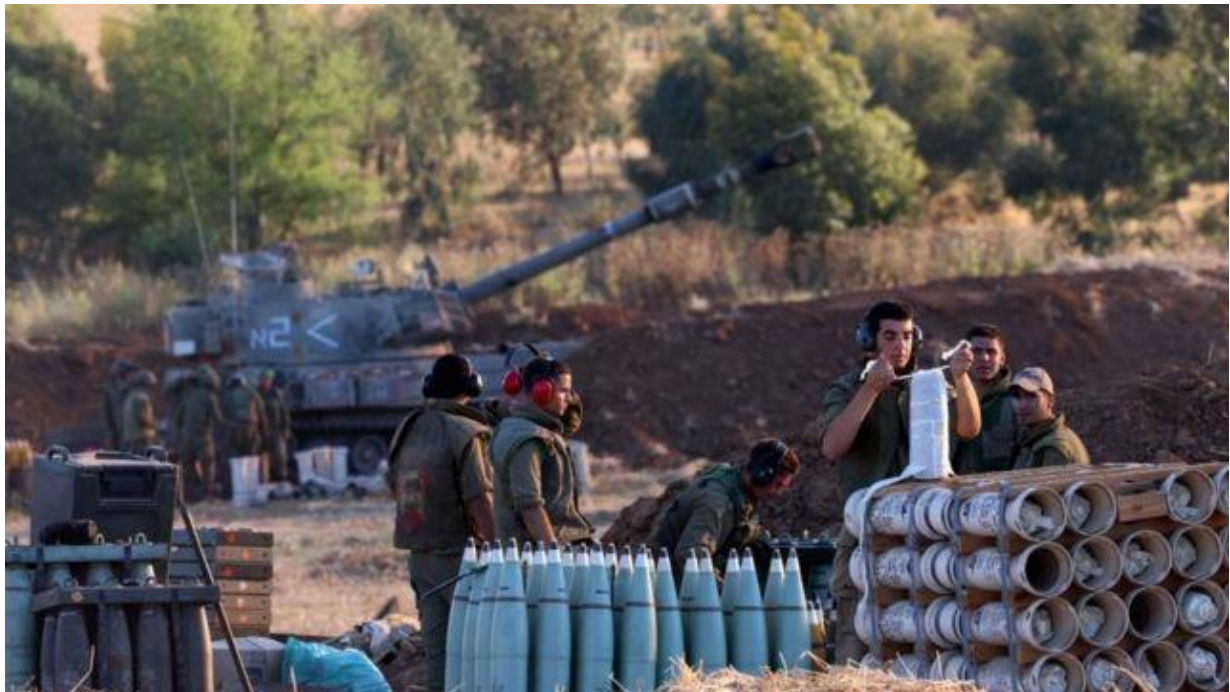
ISRAEL ENVIÓ A SUS FUERZAS A LA FRONTERA CON GAZA EN UNA NUEVA ESCALADA DE LA VIOLENCIA