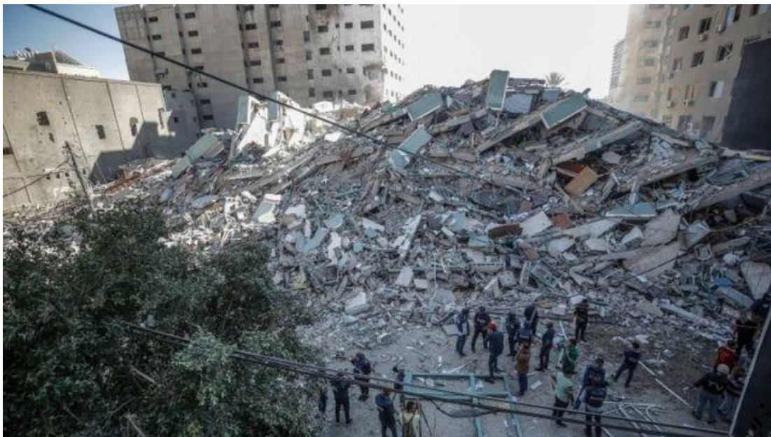
RESTOS DEL EDIFICIO QUE ALBERGABA VARIAS OFICINAS DE MEDIOS DE COMUNICACIÓN INTERNACIONALES