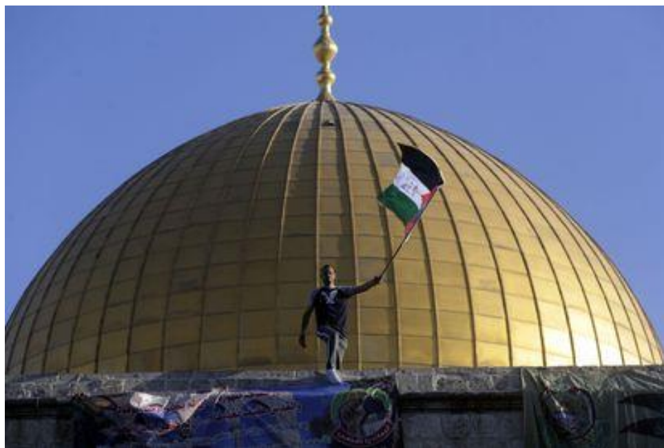
HOMBRE ONDEA LA BANDERA DE PALESTINA EN AL AQSA, JERUSALÉN, DURANTE LAS CELEBRACIONES DEL EID AL-FITR