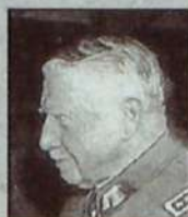
AUGUSTO PINOCHET UGARTE