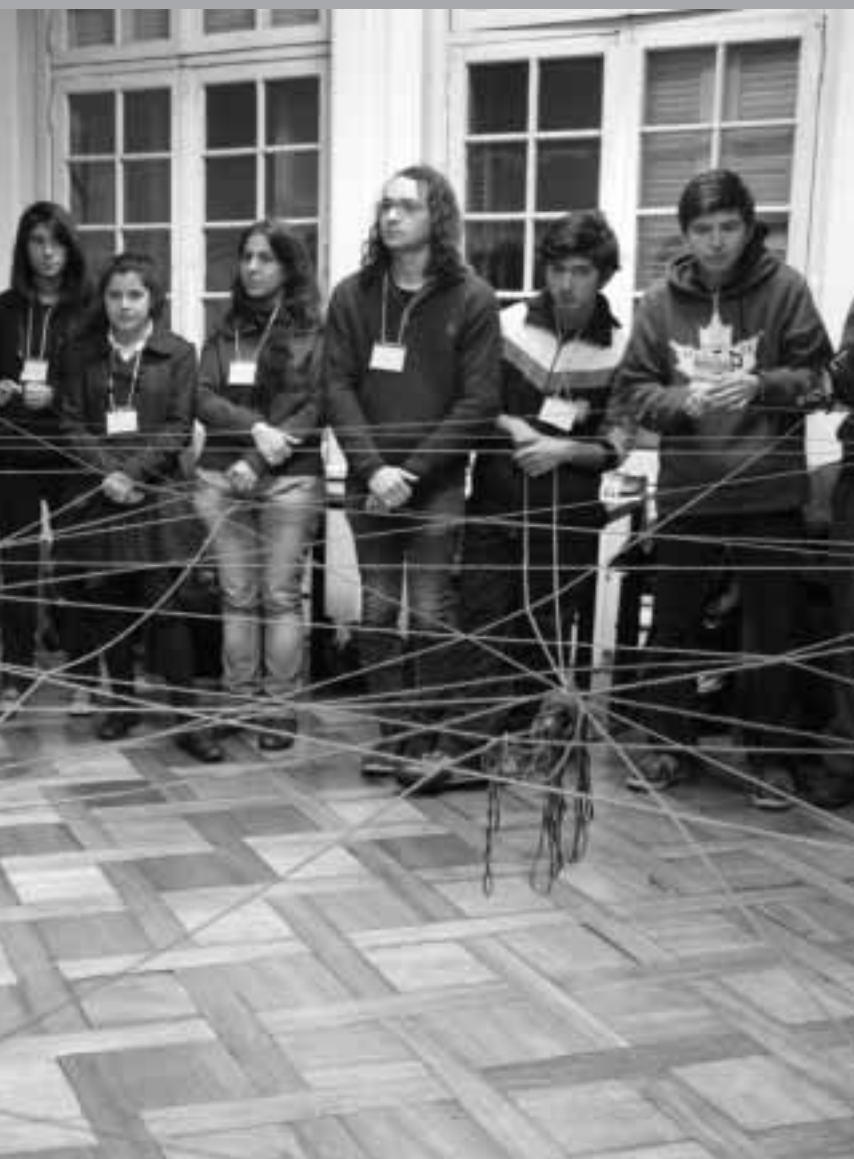
• Taller de Memoria con la participación de estudiantes universitarios y secundarios (julio 2012). Archivo de Londres 38, espacio de memorias