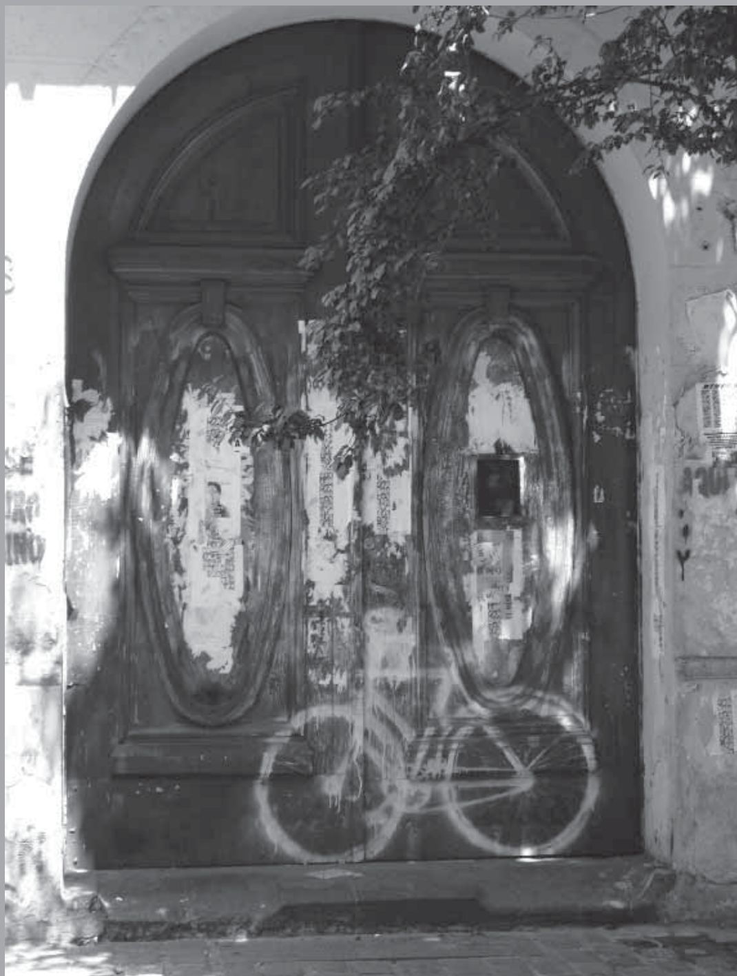
• Señalamiento en portón de entrada de Londres 38.