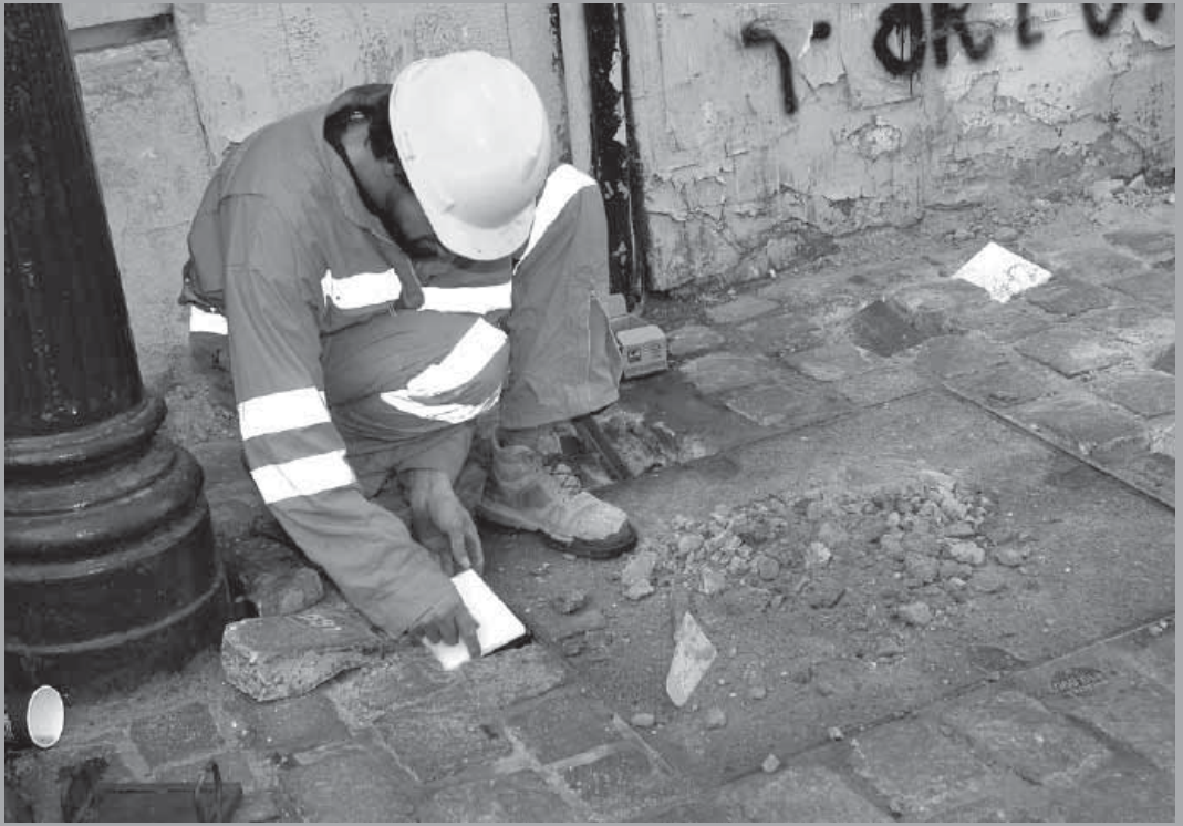
• Memorial Londres 38.