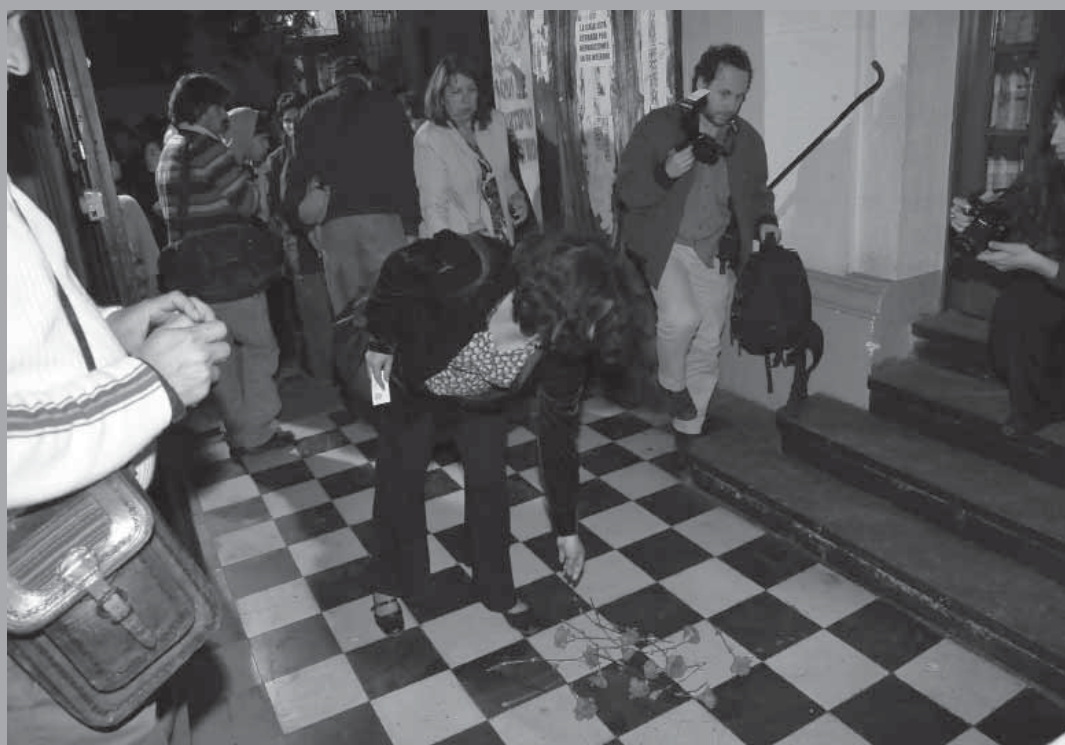
• Inauguración de Memorial. Archivo de Londres 38, espacio de memorias.