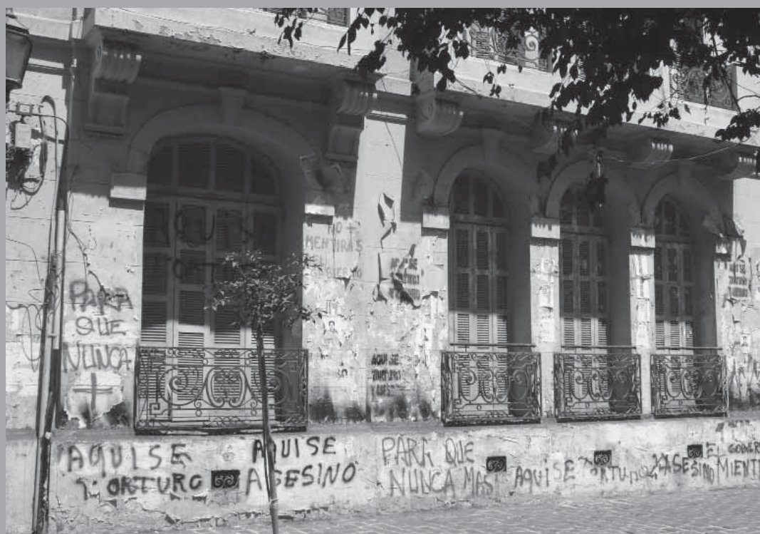
• Londres 38, 2008.