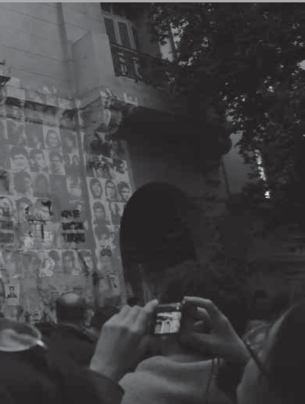
• Acciones de señalamiento de Londres 38.