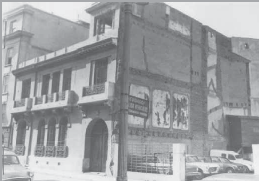
• Londres 38, años 70. Archivo de Londres 38, espacio de memorias.