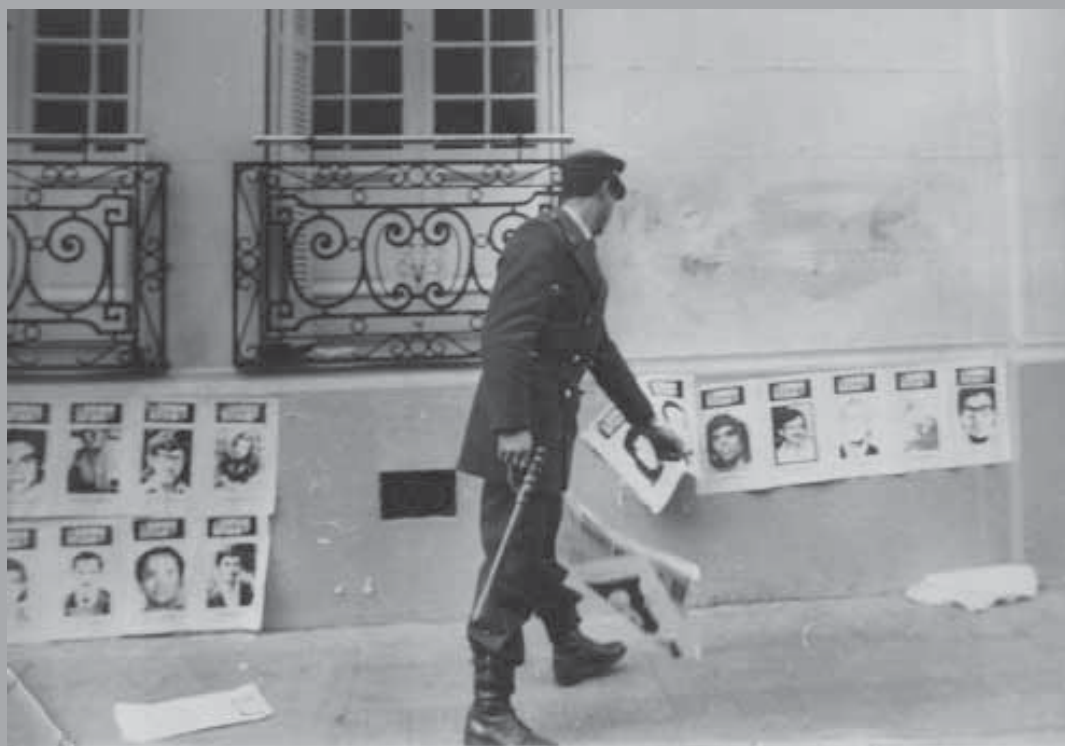
• Acciones de señalamiento de Londres 38 por agrupaciones de familiares de detenidos desaparecidos.