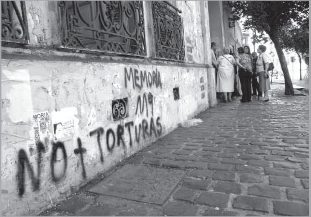
• Visita a Londres 38. Archivo de Londres 38, espacio de memorias.