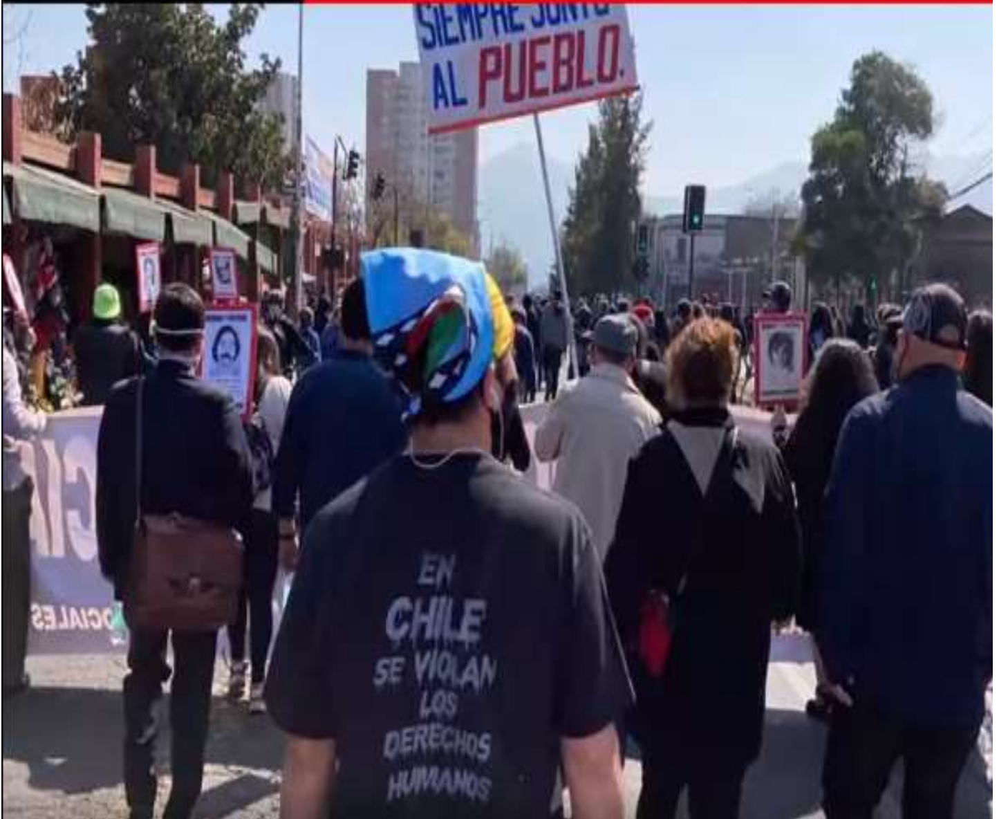
“10 de diciembre Protesta Popular por la Libertad... entrando al momento de la materialización”, pág. 41

11:00 HORAS PLAZA DE LA CONSTITUCIÓN MONUMENTO SALVADOR ALLENDE