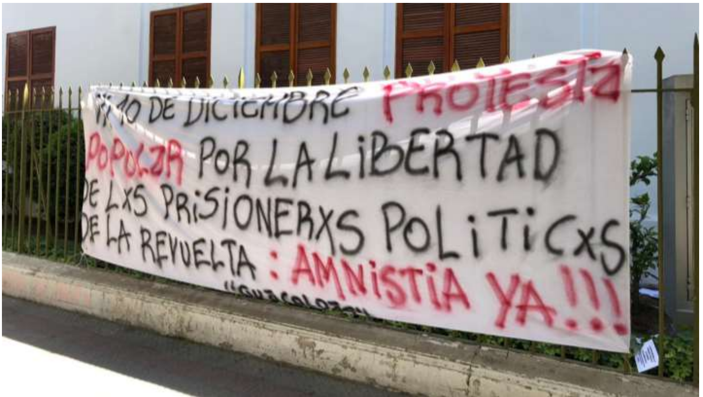
En las afueras del INDH Nacional, jueves 3 de diciembre