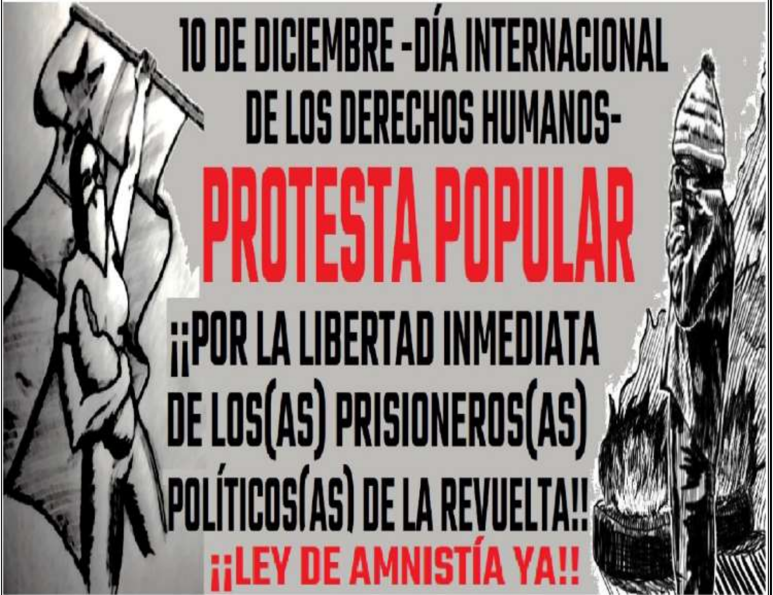
Afiche de Guacoldas de inicios de Noviembre llamando a la Jornada del 10 de Diciembre