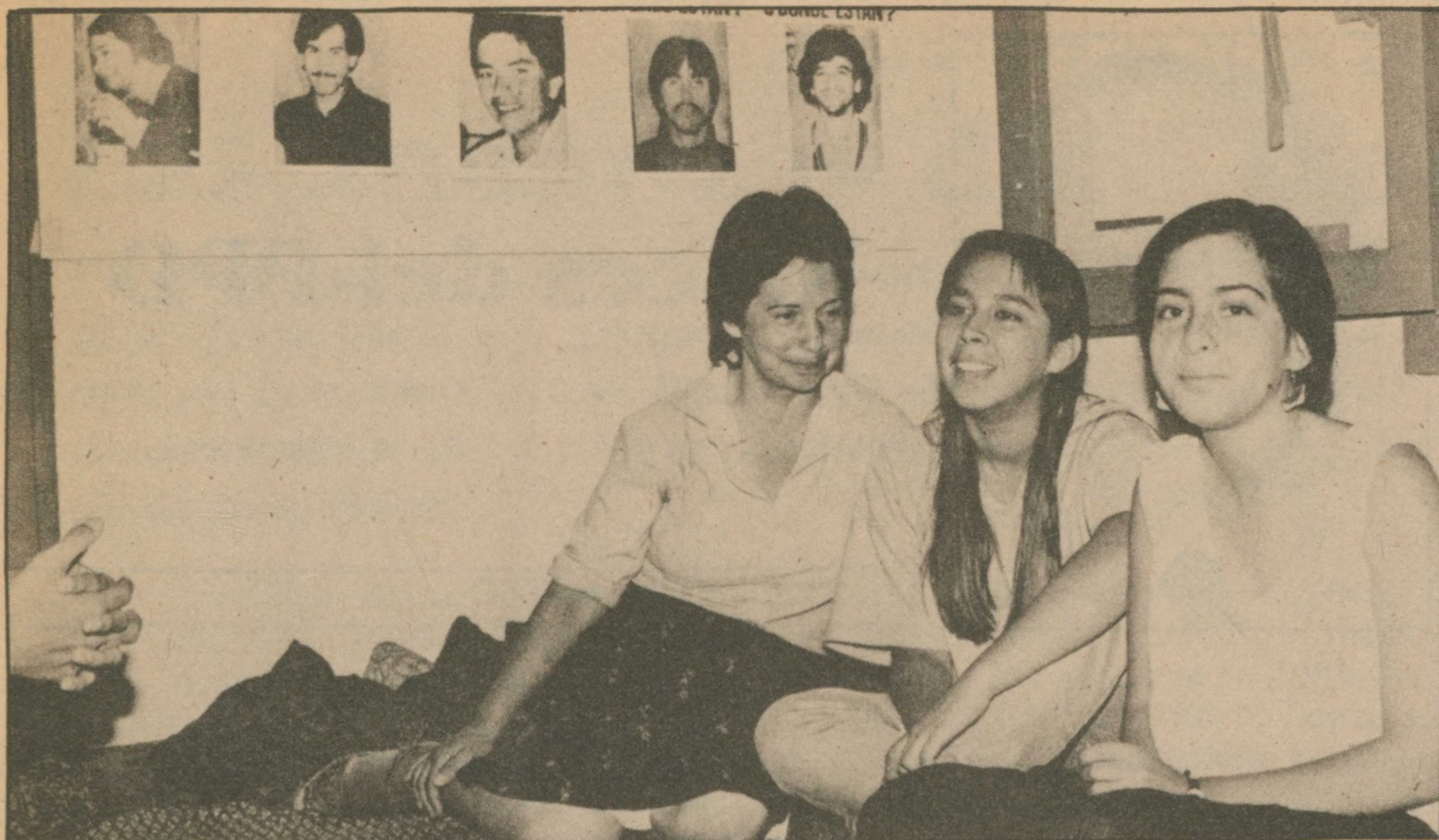
Dirigentes de Fesit: "Programa PIMO no absorbe cesantía, la incrementa".