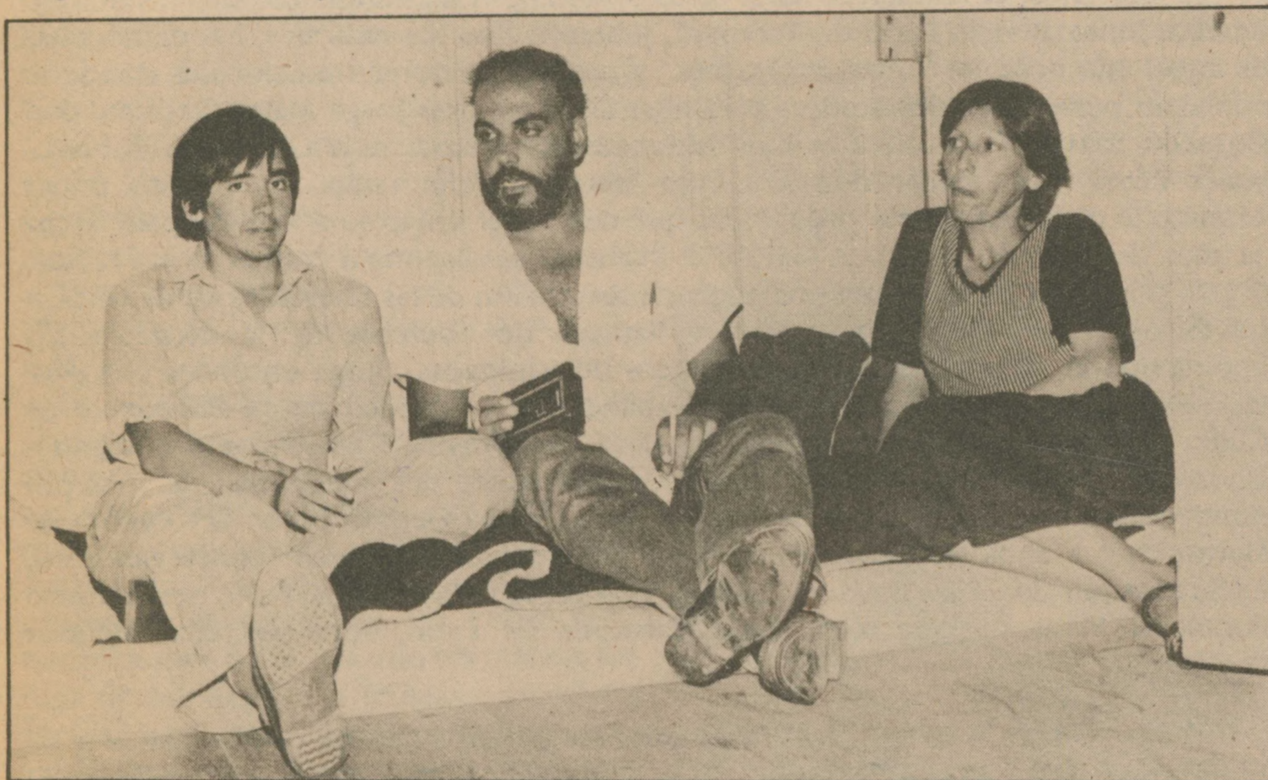
Una mamá y dos universitarias, entre ayunantes en Ingeniería de la "U".