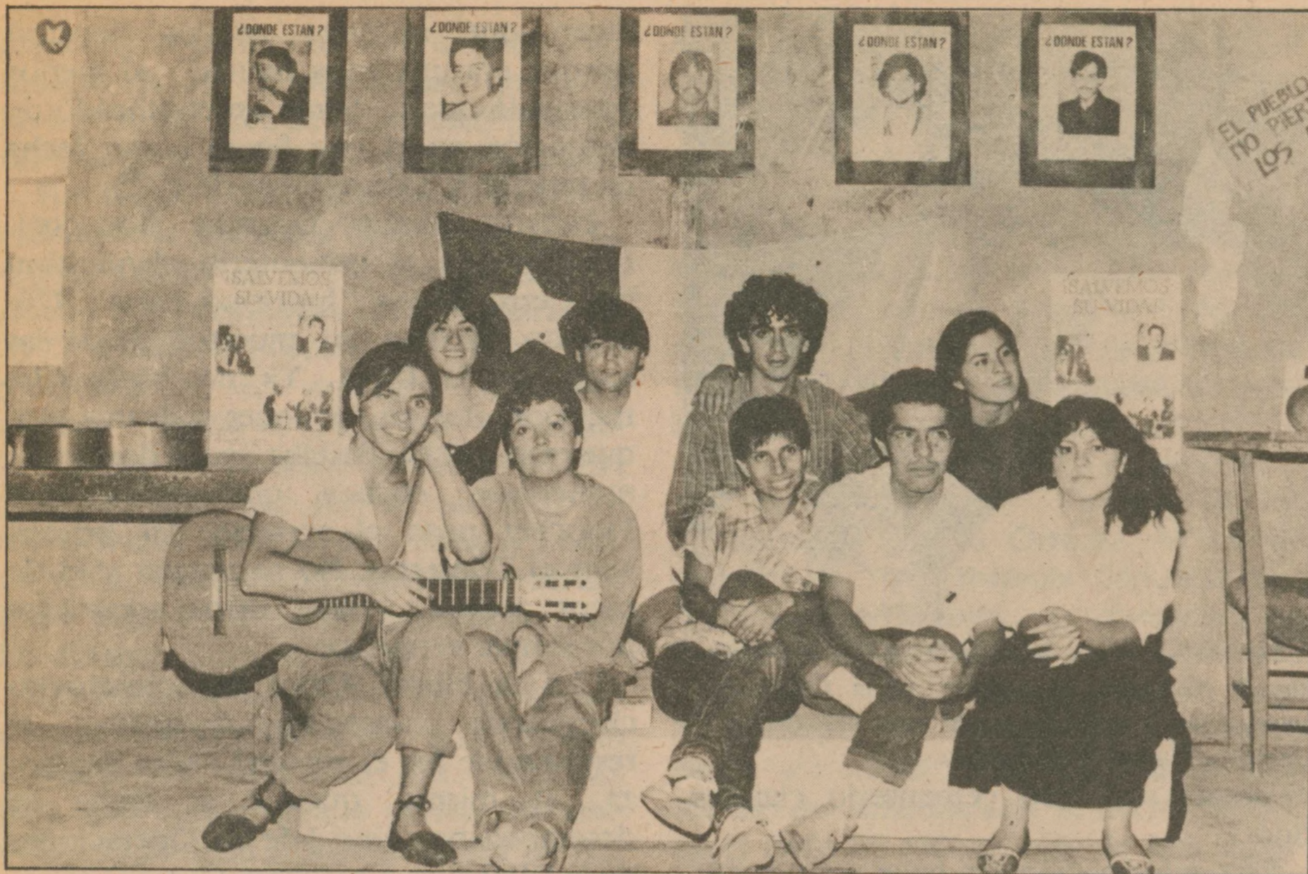
Al son de la guitarra finalizó ayuno en parroquia "Espíritu Santo".