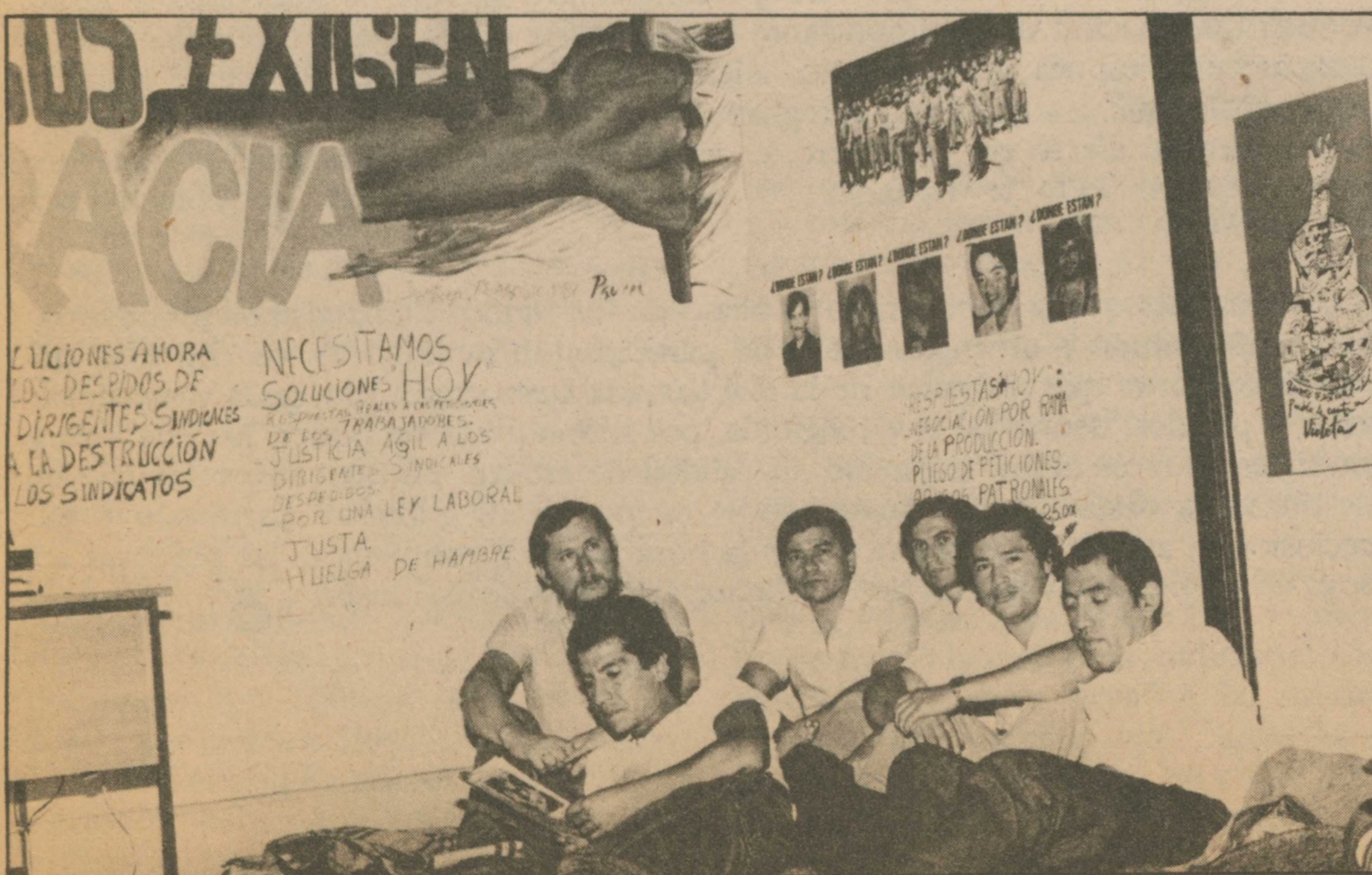
En Constramet: la huelga de hambre es por derechos laborales y para remecer conciencias.

Brasil donde funciona la Confederación de Sindicatos Metalúrgicos—seis trabajadores descansan recostados sobre colchonetas en el suelo. En una habitación continua, algunas mujeres, sus esposas, con niños de todas las edades, están brindando su apoyo. Delegaciones sindicales de los más diversos rubros entran y salen de la sede. Todos quieren entregar su solidaridad a estos compañeros que, incorporando un ingrediente de dramatismo al clima de denuncia imperante, decidieron iniciar el jueves 25 de febrero una huelga de hambre de carácter indefinido. Objetivos: "denunciar lo nefasto del Plan Laboral y la insensibilidad del Gobierno ante nuestros problemas", según señalaron en una declaración pública donde anunciaban su movimiento.