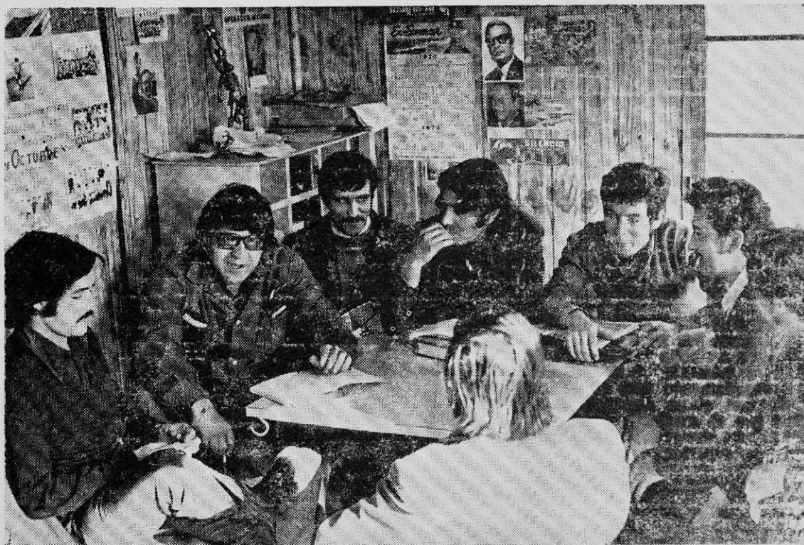
PARTE DE LOS ASISTENTES al foro sobre participación, organizado por PUNTO FINAL en la industria textil SUMAR.

mercenarios, engañando al pueblo, tal como hoy acontece.