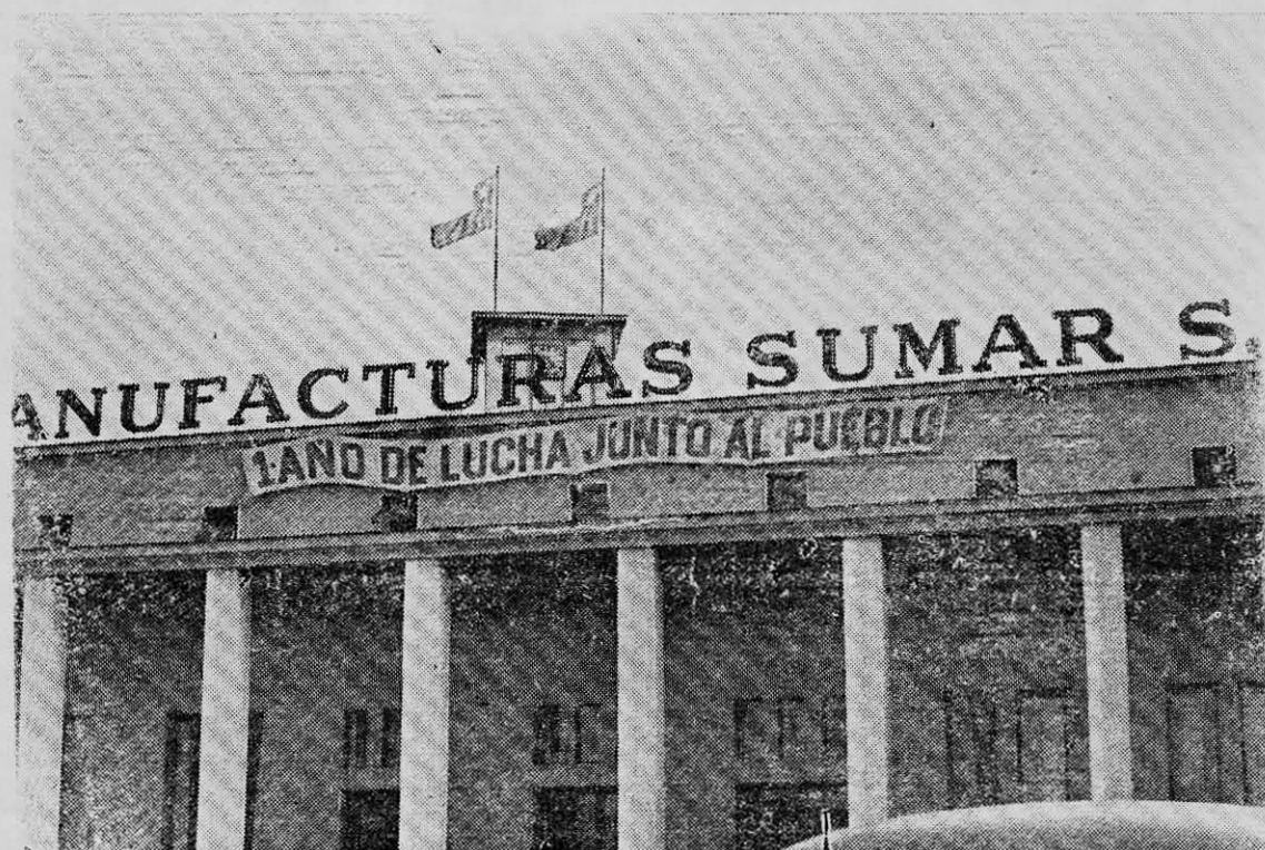
MANUFACTURAS SUMAR S.A., una de las industrias del área de propiedad social, donde se efectuó un foro sobre la participación obrera, entre dirigentes sindicales y al cual asistió PUNTO FINAL.